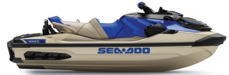
Sand y Dazzling Blue